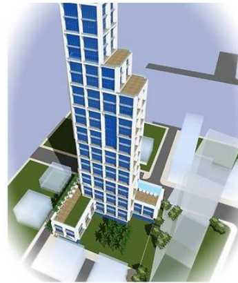
(הדמיה: חברת מנרב)

עוד כוללת התוכנית 250 מ"ר שטחי ציבור מתוך הבניינים שייבנו. בחזית המתחם כלפי רחוב הקוממיות מתוכנן ציר רחוק ברוחב של 25 מטרים, המהווה חלק מציר עירוני ראשי בהתאם לתוכנית המתאר המחוזית, המחבר את חולון, דרך בת ים מערבה לכיוון הים. המתחם ממוקם בכניסה המזרחית לעיר, בסמוך לרכבת הקלה ולנתיבי איילון.