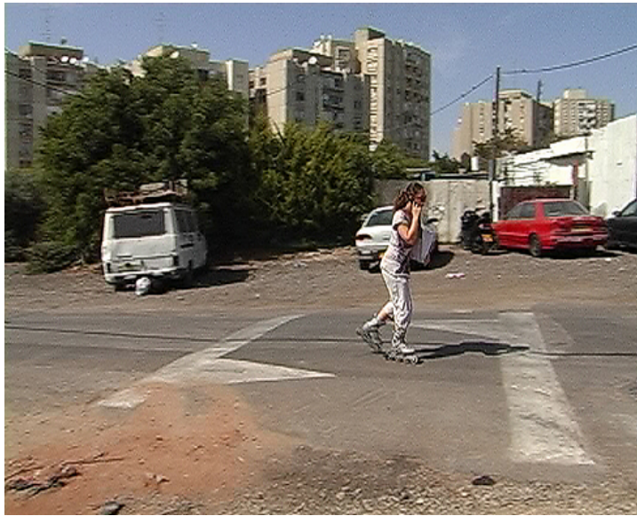
שכונת כפר שלם. תשודרג