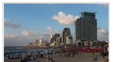
תל-אביב. משרדים את דרום העיר

ועדות התכנון אישרו תוכניות בנייה בדרום ת"א ובבת ים. בין היתר אושרה תוכנית להרחבת שכונת כפר שלם בת"א ולהקמת מגדלי תעסוקה באזור לה גווארדיה; ובבת ים אושרה תוכנית להקמת מגדל חדש בכניסה המזרחית לעיר