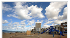
בת ים. ממשיכים לבנות